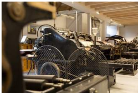
Afb. 8. 20