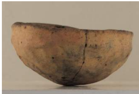
Afb. 11. 23