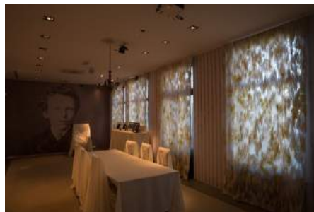
Afb. 9: 21