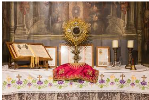
Afb. 2. 11

De verhaallijn 'Religieus Brabant' verbindt grafmonumenten, kerken, kloosters, het Rijke Roomse Leven (ca. 1850-1950) en het erfgoed van parochiecentra, pastorie en school. Iconen voor Religieus Brabant zijn bijvoorbeeld de Sint-Jan in 's-Hertogenbosch, de Grote Kerk in Breda, het Museum voor Religieuze kunst in Uden, het parochiecentrum met basiliek en kloosters in Oudenbosch en het Keltische Vorstengraf in Oss. 10