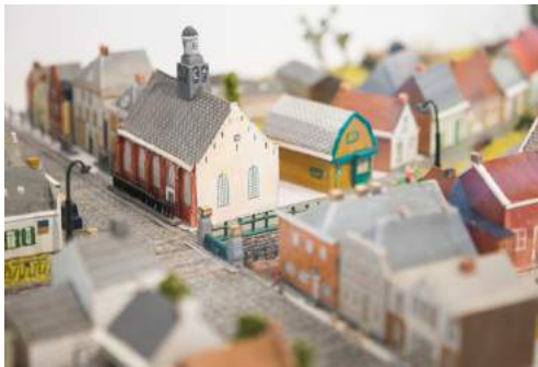
Afb. 5. 16

De verhaallijn ‘Bestuurlijk Brabant’ verbindt het erfgoed rond de bestuurlijke context en elite. De hertog van Brabant, de heer van Breda, de markies van Bergen op Zoom, en lokale edelen en de stadspaleizen, kastelen, landgoederen en buitenplaatsen. Later ontstond rondom de steden buitenplaatsen ontworpen door rijke fabrikanten. Iconen voor Bestuurlijk Brabant zijn bijvoorbeeld Markiezenhof in Bergen op Zoom en kasteel Heeswijk (beide topmonumenten). 17