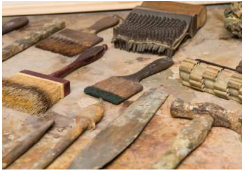
Afb. 4. 14

De verhaallijn ‘Innovatief Brabant’ verbindt het erfgoed van innovaties in landbouw en industrie. Brabant staat al eeuwen bekend om de verwerking van agrarische producten zoals textiel, leer, suiker en tabak. Eerst als huisnijverheid en na 1850 op industriële schaal, met name langs kanalen en spoorwegen. Wereldspelers als DAF en Philips zijn daarvan voorbeelden. Iconen voor ‘Innovatief Brabant’ zijn onder andere Strijp-S in Eindhoven, het TextielMuseum in Tilburg en de KVL in Oisterwijk. 15