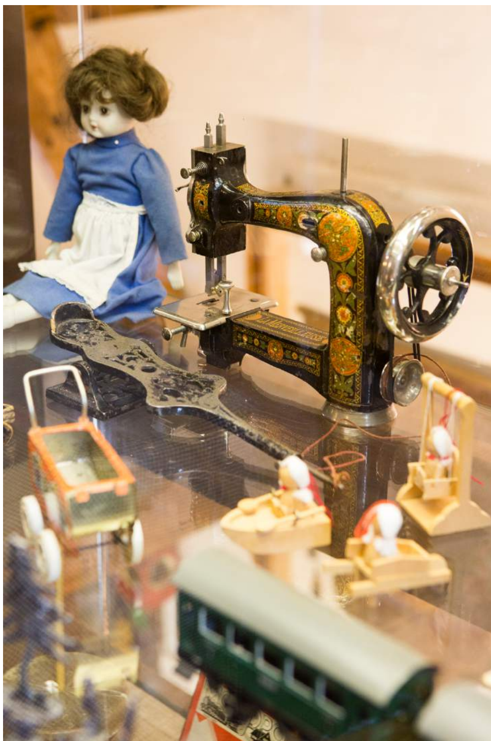
Afb. 1. 1