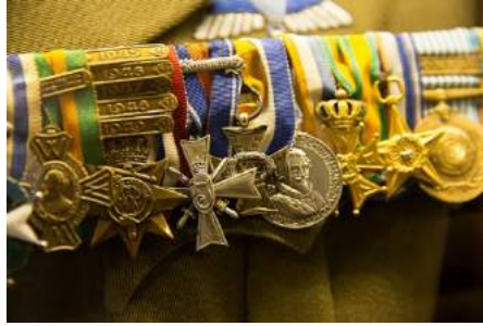
Afb. 7. 19