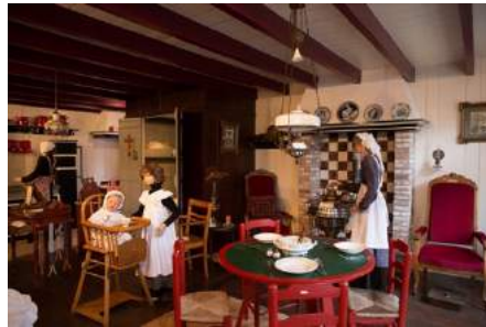
Afb. 13. 25

De deelnemende musea zijn zich erg bewust van de lokale en regionale rol die hun erfgoed speelt. De meeste collecties die hooggewaardeerd worden spelen een duidelijke rol in de regionale geschiedenis. De wat algemenere collecties, zoals voorwerpen die betrekking hebben op het dagelijks leven, worden van belang geacht door hun illustratief karakter en voor het insceneren van tijdsbeelden in tentoonstellingen.