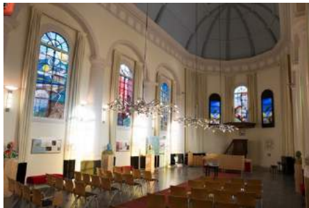
Afb. 6. 18