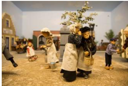
Afb. 10. 22